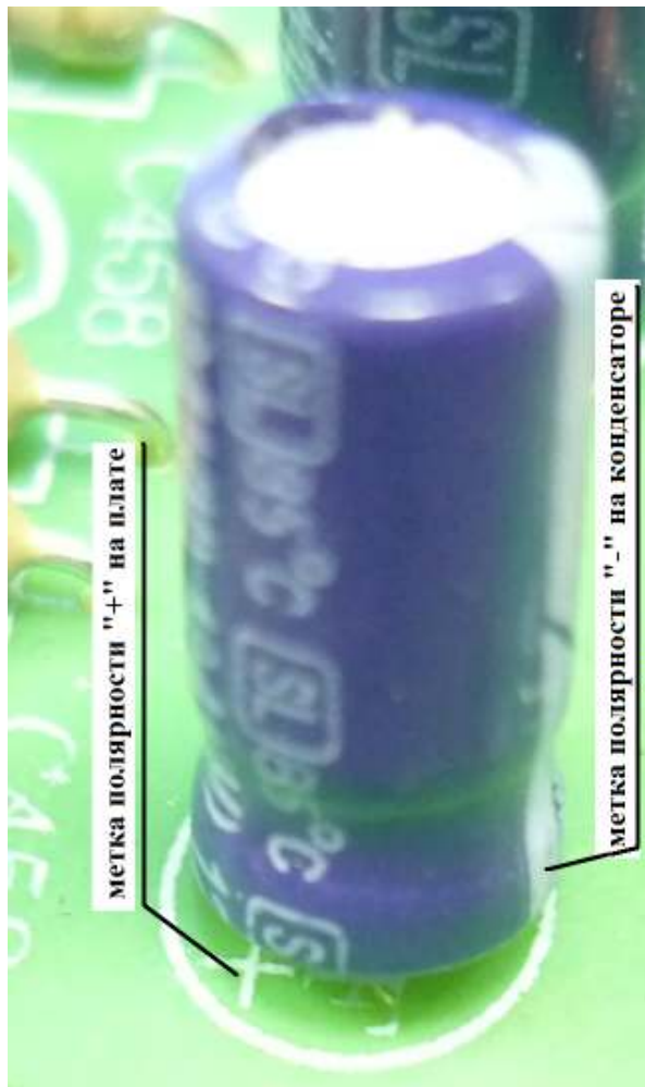
Правильно установленный на плату конденсатор