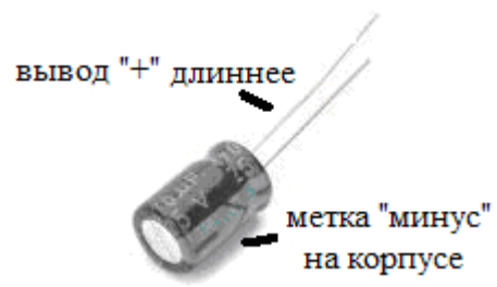
Внешний вид электролитического конденсатора